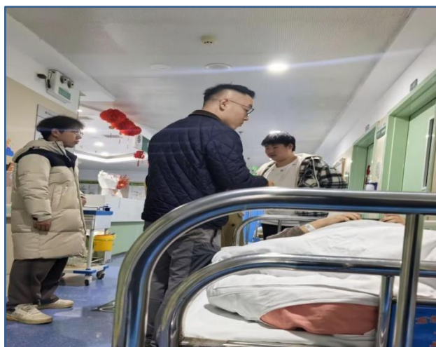
图 1 师生细心陪护瞬间

这场深夜的奔赴，是师生间最动人的担当，是同学间最真挚的守望。校园里的温暖，从来都不是惊天动地的壮举，而是危难时刻挺身而出的守护，是寒夜里始终亮着的那盏暖光，让每一个身处异乡的学子，都能感受到家的温度。